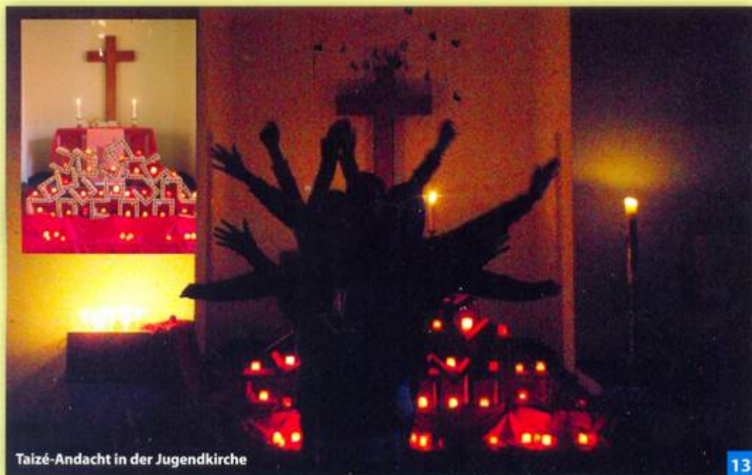
Taizé-Andacht in der Jugendkirche